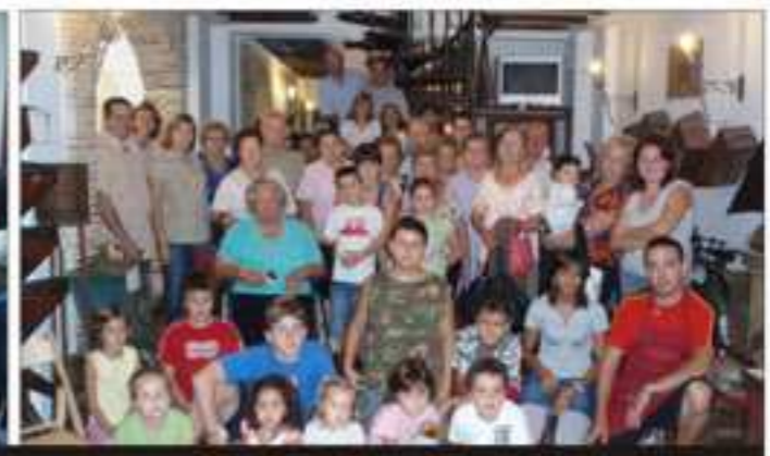
Educación: Escuela de Padres, Escuela de Abuelos

CIAJ: Asociacionismo y participación ciudadana Ferias interasociativas Sala de exposiciones Teatro, música y cine Gabinete de prensa