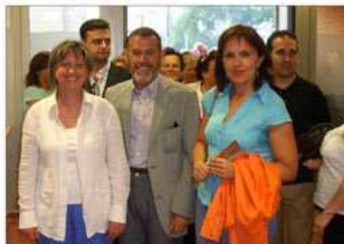
Centro de Día de Personas Mayores y Centro de Convivencia Jubilados