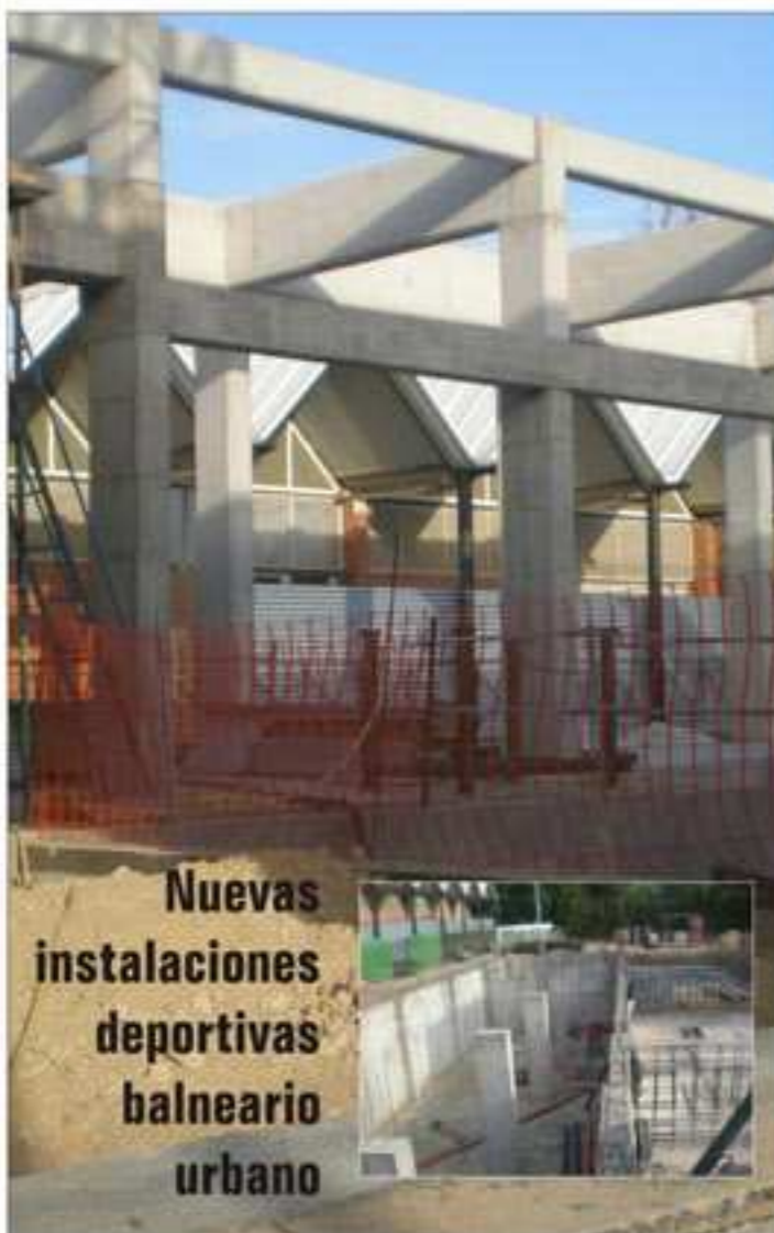
Nuevas instalaciones deportivas balneario urbano