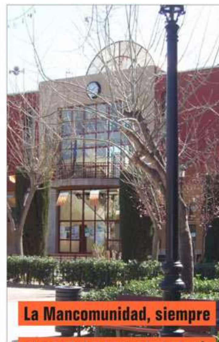
La Mancomunidad, siempre al servicio de la ciudadanía