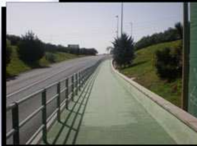
Nuevo acceso peatonal entre el Barrio del Cristo y Quart de Poblet

Revista intermunicipal informativa de la Mancomunidad Barrio del Cristo (Aldaia - Quart de Poblet) Número 50 -año 18- Marzo Abril 2011