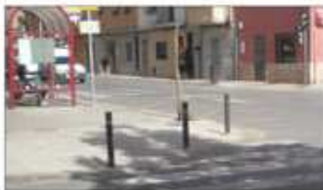
Accesibilidad viaria y repavimentado de viales