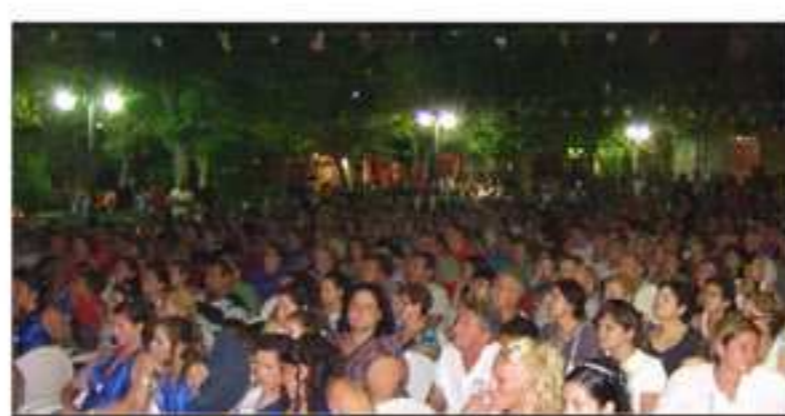
Les nostres Festes