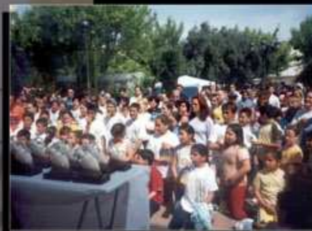
Los días 9 y 10 de Abril se realizará la Feria Interasociativa

Cultura y Juventud -CIAJ- Formación y Empleo. Personas mayores. Igualdad. Obras y servicios. Servicios Sociales. Educación. Deportes.