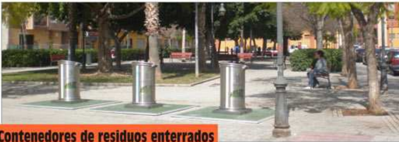
Contenedores de residuos enterrados

Durante este tiempo el Barrio del Cristo ha alcanzado una verdadera imagen como REFERENTE comarcal, una tarea compartida y conjunta tanto por los colectivos sociales y el fenómeno asociativo, como por la excelente gestión de la Mancomunidad y sus municipios, sus Ayuntamientos, Quart y Aldaia, dotándolo de los servicios, programas e infraestructuras necesarias para el confort y disfrute de toda nuestra ciudadanía. Barri del Crist, orgull d'una "població".